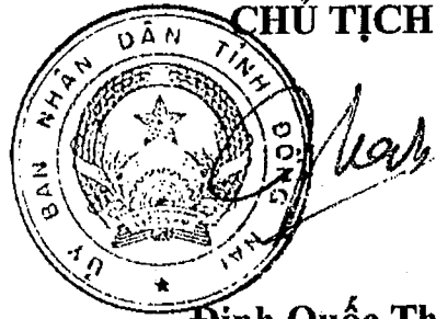
Đinh Quốc Thái