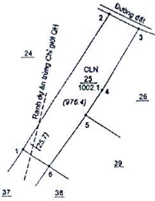
TRÍCH LỤC BỒ ĐỒC KHU ĐẤT PHƯỜNG HIỆP HÒA Có các thửa 25 TỜ SỐ 55 Tỷ Lệ 1:2000